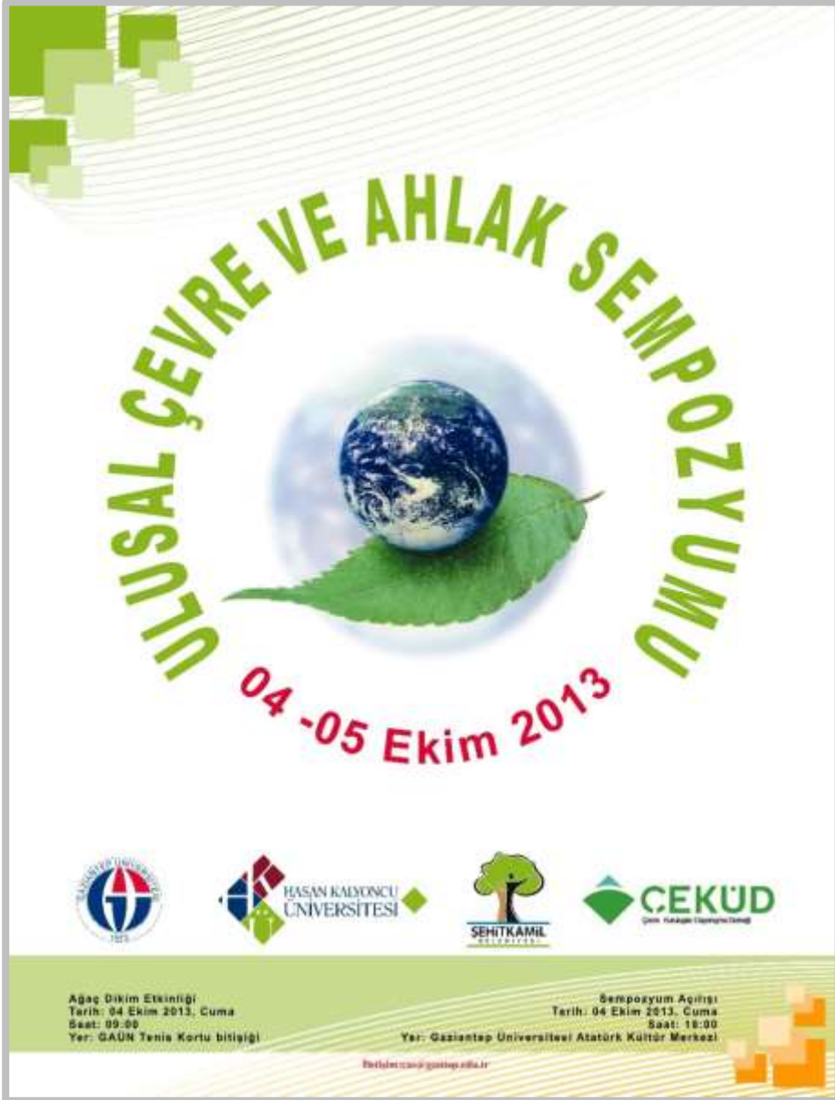
Afiş 1- Sempozyum Afişi