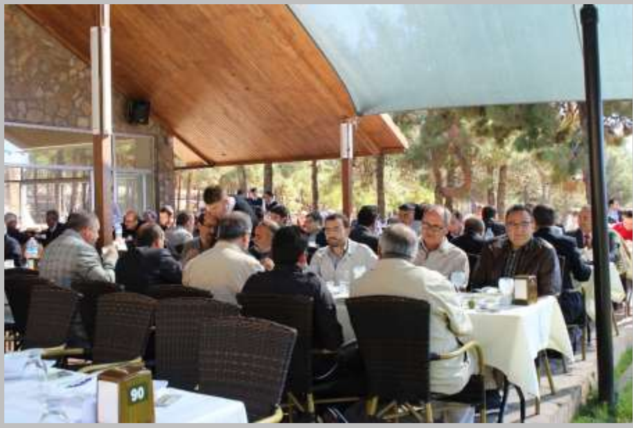
Fotoğraf 12 - Şehitkâmil Belediyesi Dülük Baba Tesisleri'nde Veda Yemeđi