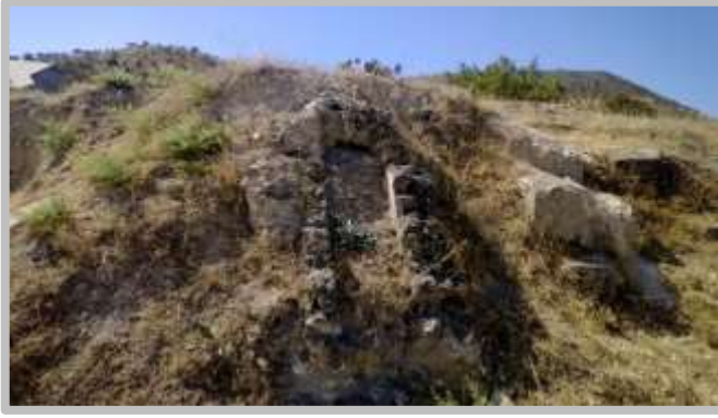
Resim6(Kirli Su Kanalı)