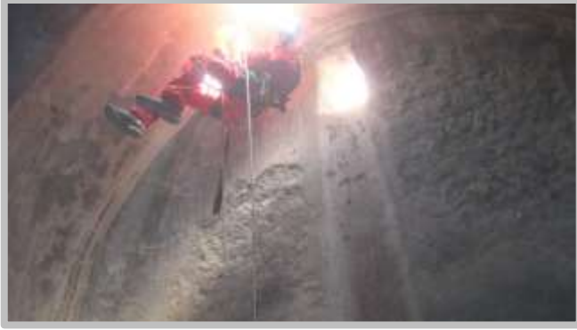
Resim 4(Büyük Sarnıç)