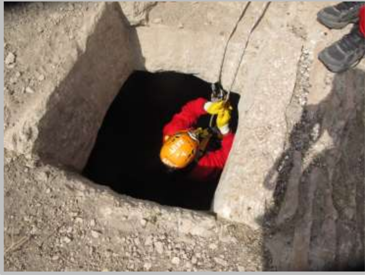
Resim 2(Belkıs Tepesindeki Büyük Sarnıç)