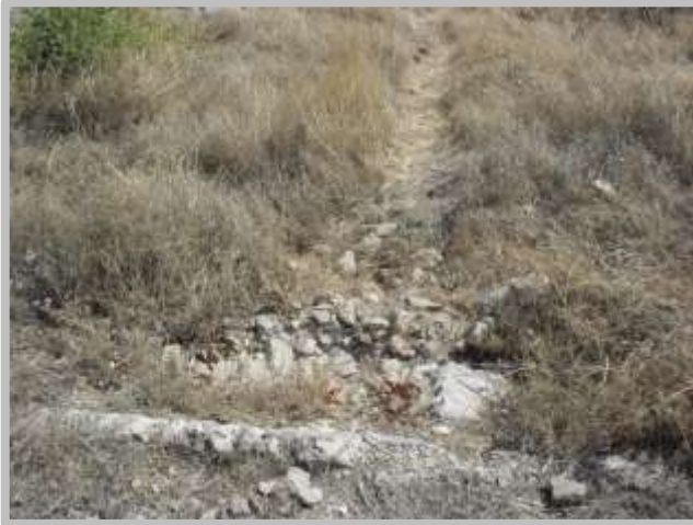
Resim 5(Temiz Su Kanalı)