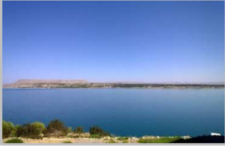
Resim 1(Fırat Nehri)