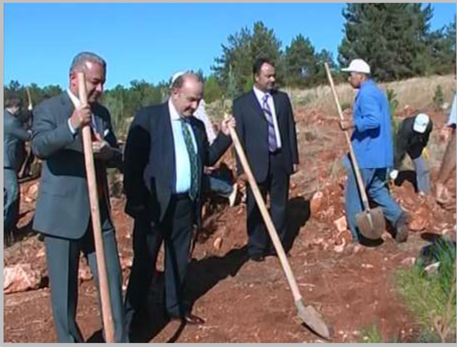
Fotoğraf 9 - Şahinbey Kaymakamı ve Gaziantep Üniversitesi Rektörü Ağaç Dikerken